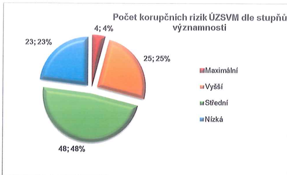
Obrázek č. 1 Počet korupčních rizik dle stupňů významnosti